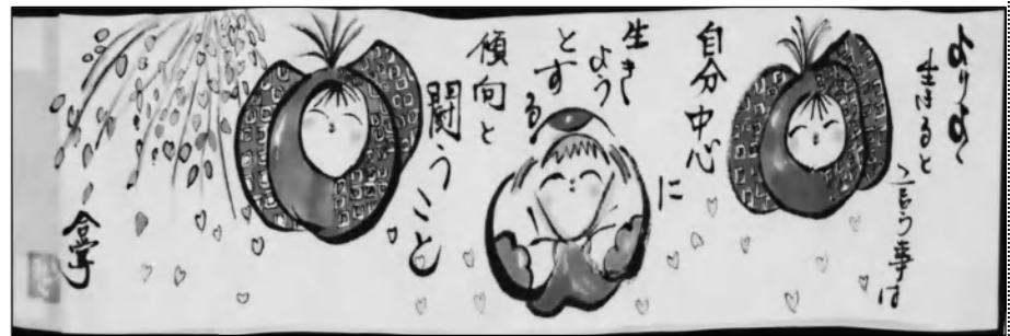
「南星台絵手紙の会」より

(質問) 本市の魅力のひとつは、都市郊外でありながら自然が豊かであり、大阪市内・京都市内への通勤圏にある。この恵まれた環境を守り、活用していくことが重要である。